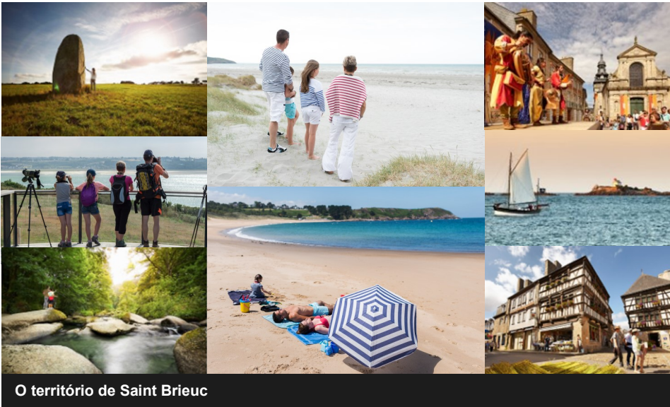
O território de Saint Brieuc