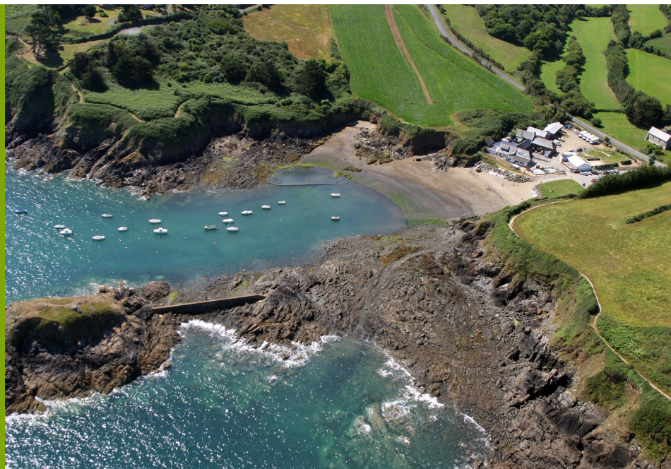
Port Saint Marc - Tréveneuc