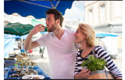
Gastronomia no Pays de Saint Brieuc